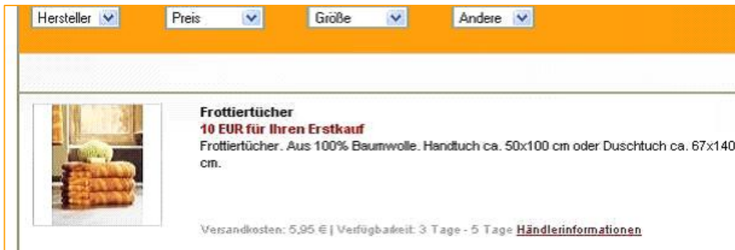
[Angebot mit Promotext]

Diese dienen dazu, bestimmte Angebote oder Aktionen in den Ergebnislisten hervorzuheben. Das könnte z. B. ein Gutschein für den Erstkauf sein.